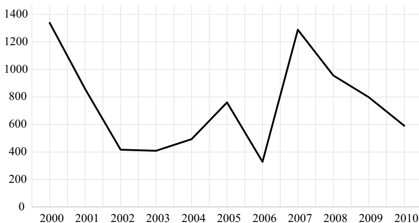
Рис. 3. Объем финансирования ICT4D-проектов Всемирного банка в 2000–2010 гг., млн долл. 33

Довольно крупными были и затраты других организаций. По подсчетам Р. Хикса, в 2009 г. на проекты ICT4D Агентство международного развития США (United States Agency for International Development, USAID) тратило примерно 800 млн долл. в год, Японское агентство международного сотрудничества (Japan International Cooperation Agency, JICA) — примерно 200 млн долл. в год, Корейский институт развития информационного общества (Korean Information Society Development Institute, KISDI) — 25 млн долл. в год.